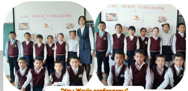
"Ұлы Жеңіс сарбаздары" "Жігіт сұлтаны" тәрбие сағаттары 3 "Ә" сынып